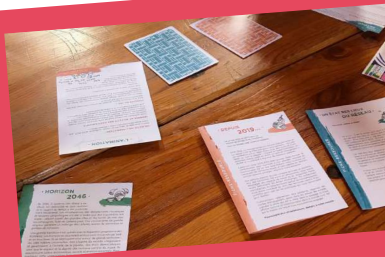
Les premières émulations avec le kit...

2046, mais pourquoi si loin ? Il nous a semblé important de cesser de réagir au quotidien et de prendre la main sur notre avenir, l'anticiper, le façonner à notre image, de dire le monde que nous voulons pour demain. La mise en œuvre du projet confédéral 2023-2027 constituera ainsi un premier palier important vers ce futur commun.